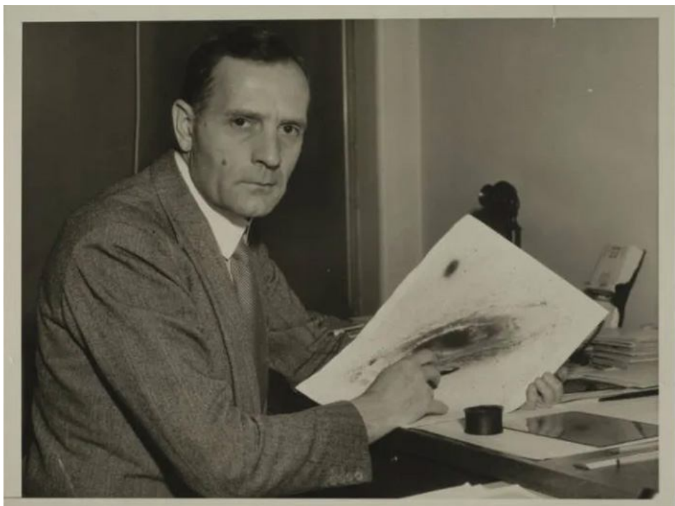
Эдвин Хаббл со снимком Туманности Андромеды в своем кабинете, 1931 год. Исследуя эту галактику в начале 1920-х годов, он понял, что она расположена за пределами Млечного Пути.

Постоянная Хаббла определяет скорость расширения современной Вселенной и потому представляет огромный интерес для астрофизики и космологии. Ее численные значения многократно оценивались разными способами без малого сто лет и в начале нашего века считались установленными достаточно надежно и в довольно узком интервале. Однако в прошлом десятилетии стали публиковаться другие значения постоянной Хаббла, которые оказались приблизительно на 10% меньше предшествующих. Это расхождение, получившее название Hubble tension («хаббловское напряжение»), до сих пор так и не удалось устранить. Для его объяснения выдвинуто великое множество гипотез, однако к решению проблемы они не привели. Недавно был опубликован ряд статей на эту тему, основанных на последних данных, полученных, в том числе, и на космическом телескопе имени Джеймса Уэбба. Описанные результаты, из-за того, что они более точные, даже усугубляют проблему.