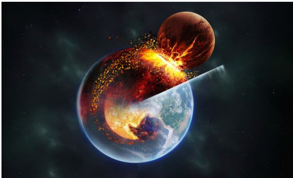
Так в представлении художника выглядело столкновение Земли с гипотетической планетой Тейя. Ученые предполагают, что остатки вещества Тейи сохранились в глубокой мантии Земли.

Считается, что Луна образовалась в результате столкновения Земли с гипотетической планетой Тейя, которое произошло примерно 4,5 миллиарда лет назад — через несколько десятков миллионов лет после формирования Солнечной системы. До сих пор никаких вещественных свидетельств существования Тейи найти не удалось. Результаты недавнего исследования, проведенного международной группой ученых, позволяют предположить, что фрагменты Тейи сохранились в недрах Земли, где на границе нижней мантии и ядра расположены два крупных участка более плотного, по сравнению с окружающими породами, вещества. Предложенная авторами новая модель «гигантского столкновения» позволяет ответить на многие спорные вопросы, касающиеся формирования Луны, Земли и других планет Солнечной системы. В конце 1970-х годов геофизики, используя новаторский для того времени метод глубинного зондирования Земли — сейсмической томографии (Seismic tomography), — обнаружили на границе ядра и мантии (Core–mantle boundary) две области, в которых скорости прохождения поперечных (или сдвиговых) сейсмических волн были аномально низкими. Сейсмологи назвали их крупными областями с низкой скоростью сдвига (LLSVP — Large low-shear-velocity provinces). Одна расположена под Африкой, другая — под Тихим океаном. Они, подобно паре огромных наушников, с двух сторон охватывают ядро Земли. Размер их в поперечнике — несколько тысяч километров, а по вертикали — от 200 до 1000 км