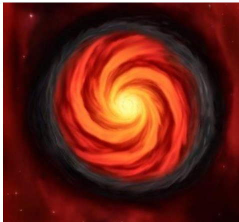
Отрисованная структура массивной звезды G358-MM1, полученная по итогам снимков с телескопов

Астрономы приблизились к разгадке, как рождаются звезды и эволюционируют галактики