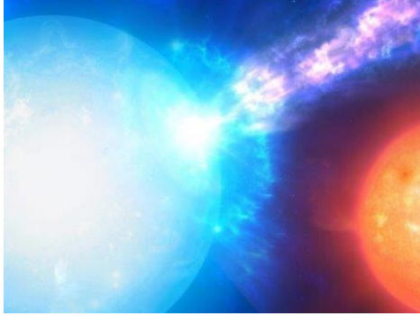
Микроновая глазами художника © Mark Garlick